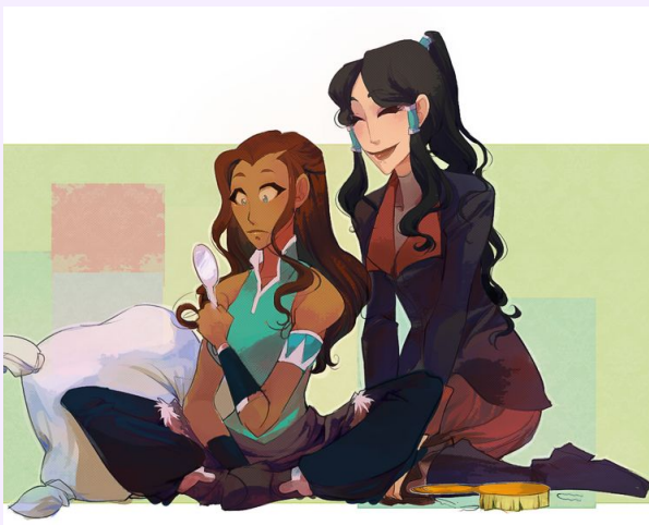
Korrasami. Art : chocolapeanut (dA)

Une chose, toutefois, les fait rougir en secret, les exalte ou les terrifie : le sexe . Quatre lettres et ce \lambda obscène. Pour le remplir, des images, des mots, des sons ouïs dans la pénombre... Quoi d'autre ? Un frémissement lorsque deux mains se frôlent, la chaleur confuse d'un désir qui surgit sans se dire, l'ivresse silencieuse d'un fantasme qui s'égaie en esprit et ce faisant, libère. Oui : le sexe a un goût d'émancipation. Comme elle terrifiant, comme elle convoité.