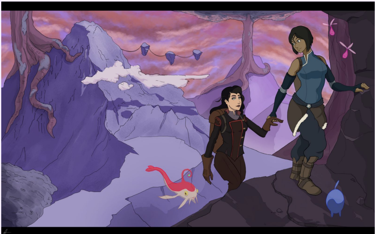
Journey. Art : Albertrech (dA)

Les flavor texts sont affichés sur le seuil de chaque lieu de passage d'un acte (monde) à l'autre.